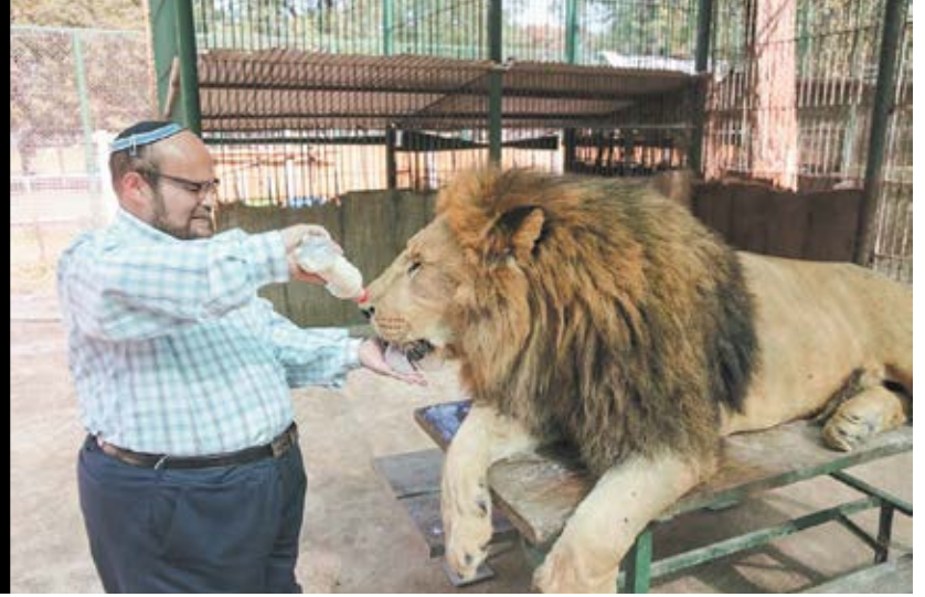
ללא דרכון זר, ללא אנגלית מהוקצעת. מסעות גרנות ברחבי העולם, מימין עם כיוון השעון: בירדן, בארגנטינה, בדרום קוריאה ושוב בארגנטינה